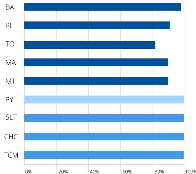
*Aprovisionamiento directo de regiones en: